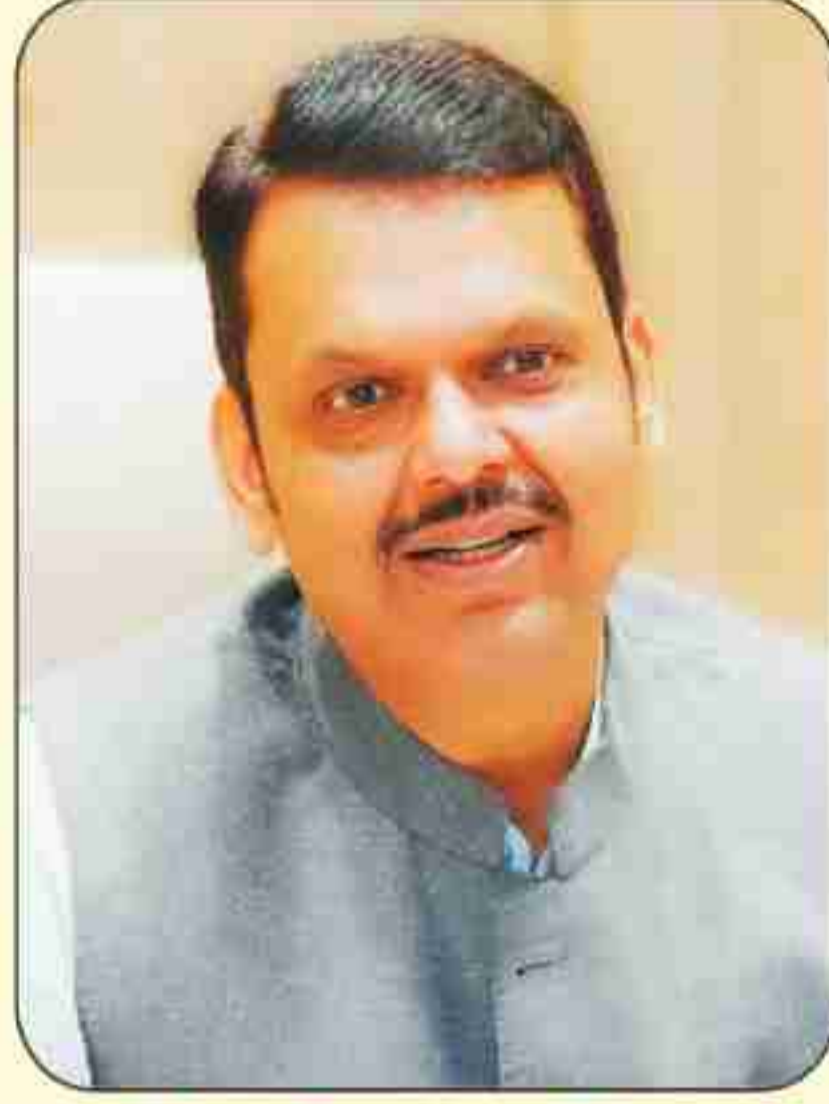
ना. देवेंद्रजी फडणवीस साहेब मुख्यमंत्री, महाराष्ट्र राज्य