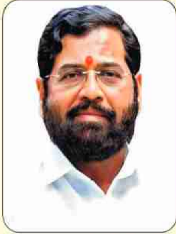
ना. एकनाथजी शिंदे साहेब उपमुख्यमंत्री, महाराष्ट्र राज्य