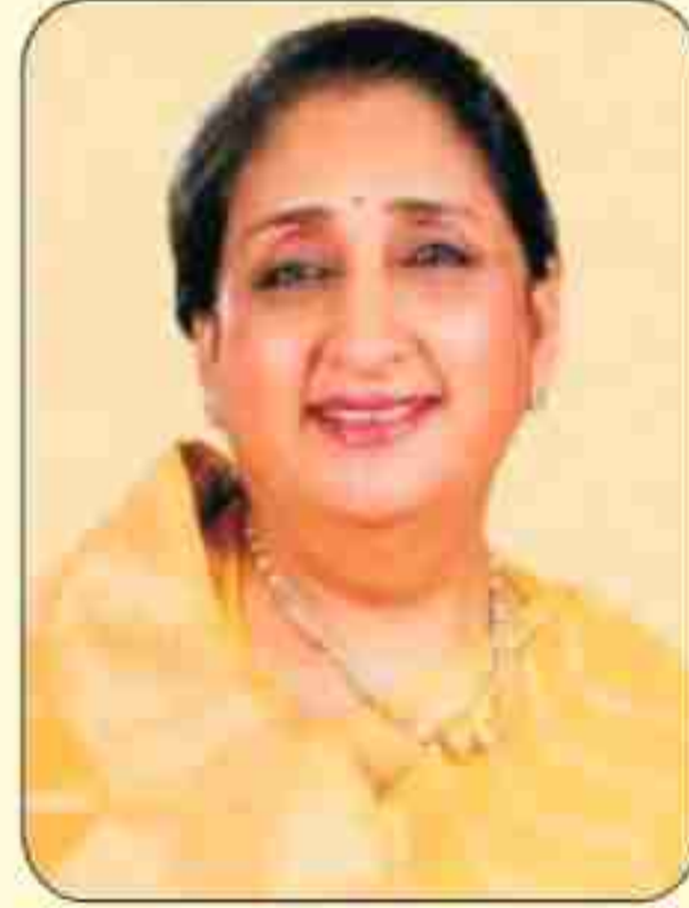
ना. सुनेत्राताई अजितदादा पवार उपमुख्यमंत्री, महाराष्ट्र राज्य